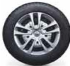
16" Steel wheel with half wheel cover, 6,5J x16, tyres 215/60 R 16 (RS2 & QPB)