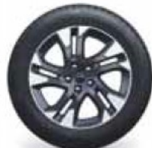
17" Bi-colour diamond cut alloy wheels with shiny black bolt caps, 7J x 17, tyres 225/55 R 17 (WQX)