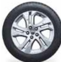
17" Silver alloy wheels with chrome bolt caps, 7J x 17, tyres 215/60 R 17 (RVF)