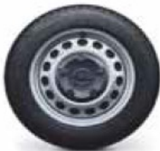
16" Steel wheel with half wheel cover, 6,5J x16, tyres 215/60 R 16 (RS2 & QPB)