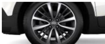
17" Multierade lättmetallfälgar, machine finished