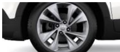
17" Silverfärgade lättmetallfälgar med dubbelekrar