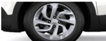
16" Silverfärgade lättmetallfälgar med fyra dybbelekrar