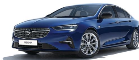
G4B - Nautic Blue