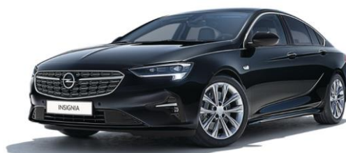
GB9 - Mineral Black