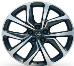
20" Lättmetallfälgar Grey Gloss Diamond Cut 8.5J x 20 Kod: PYU