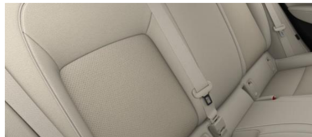
TASQ - Läderklädsel Siena II - Beige