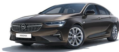
G1S - Stone Brown