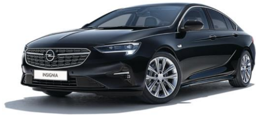
GB9 - Mineral Black