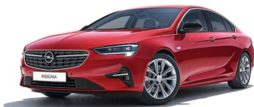
G1R - Peperoncino