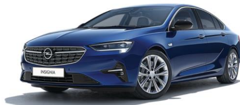
G4B - Nautic Blue