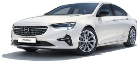
GAZ - Summit White