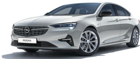
GAN - Switchblade Silver