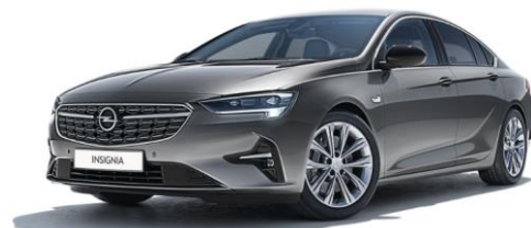
GF6 - Statin steel Grey