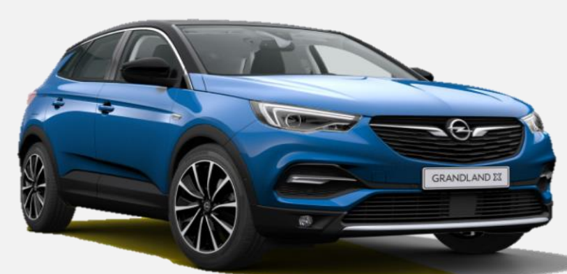
Topaz Blue G8Z 7 900kr