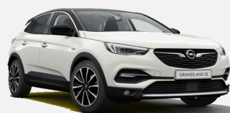
Pearl White G1o 7 900kr