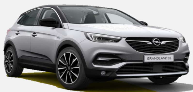
Quartz Grey G4i 6 900kr