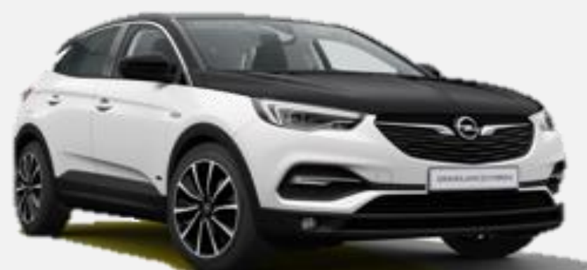
Svart Motorhuv CNP 2 500kr Tillval Ultimate