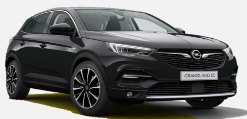
Diamond Black G7o 6 900kr