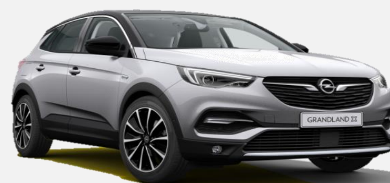
Quartz Grey G4i 6 900kr