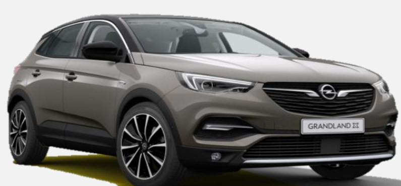
Moonstone Grey G4o 6 900kr