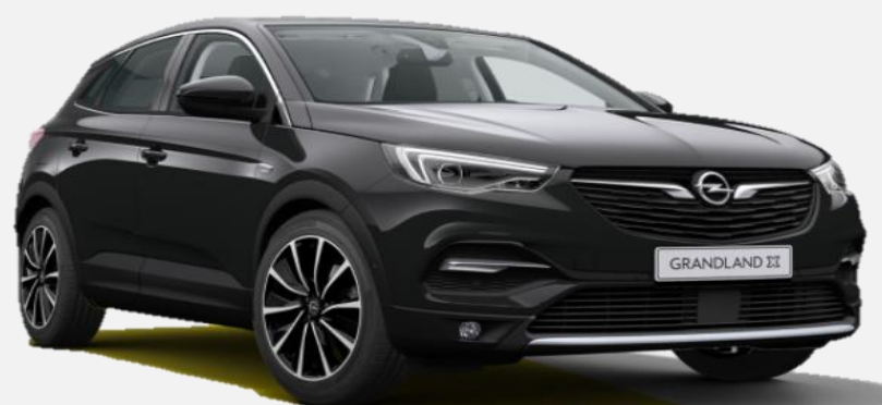
Diamond Black G70 6 900kr