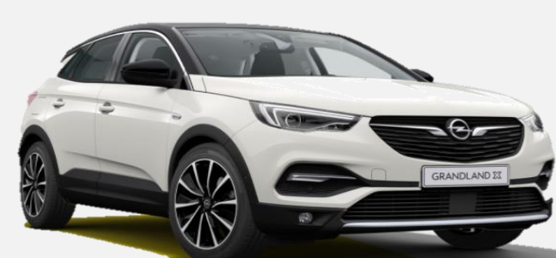
Pearl White G1o 7 900kr