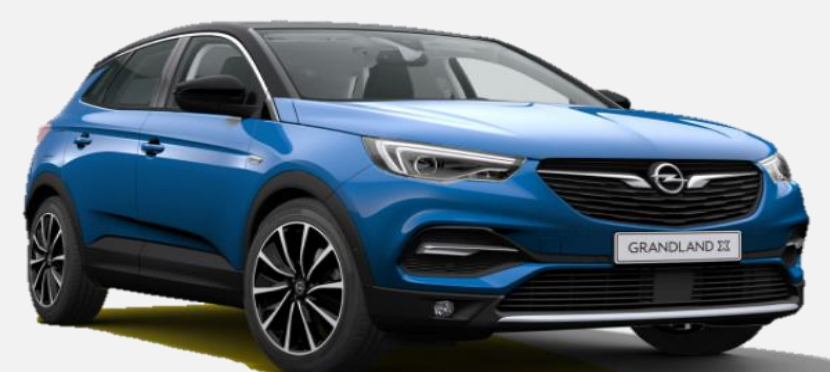
Topaz Blue G8Z 7 900kr