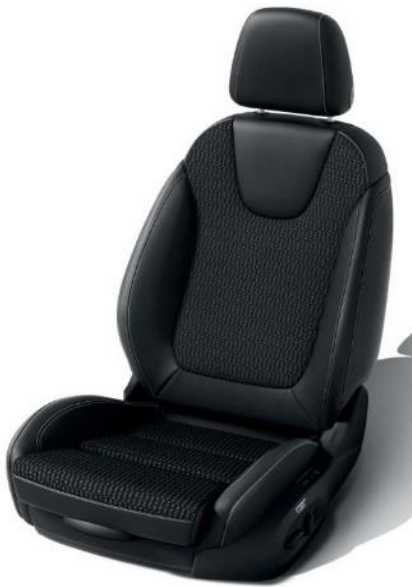
TASM - Tyg/Vinylklädsel, "Monita" Jet black