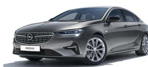
GF6 - Statin steel Grey