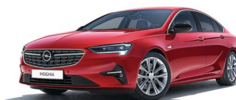
G1R - Pepperoncino