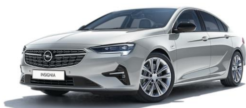
GAN - Switchblade Silver