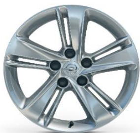
17" Lättmetallfälgar Silver 7.5 J x 17 Kod: RSC