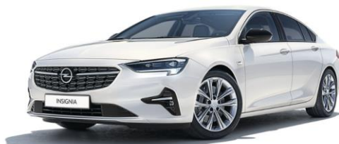
GAZ - Summit White