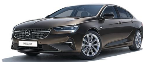
G1S - Stone Brown