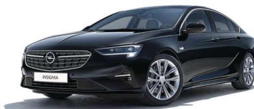
GB9 - Mineral Black