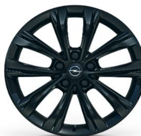
18" Lättmetallfälgar Multi-Spokes Design, black gloss Kod: RRM