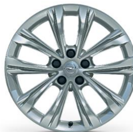
18" Lättmetallfälgar Multi-Spokes Design, Silver Kod: RQ8