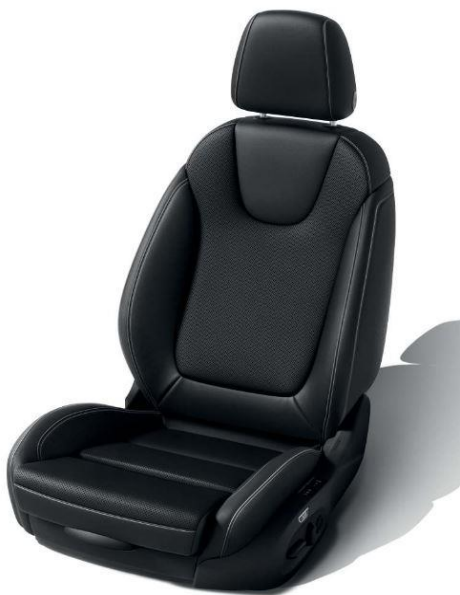
TATW - Läderklädsel Siena II - Jet Black