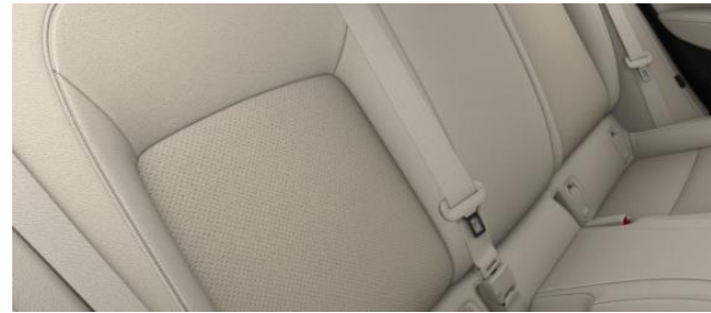
TASQ - Läderklädsel Siena II - Beige