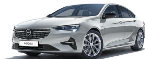
GAN - Switchblade Silver