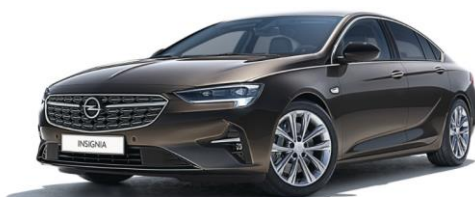
G1S - Stone Brown