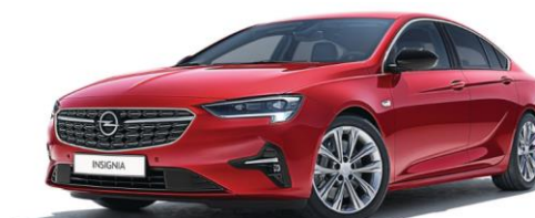
G1R - Pepperoncino