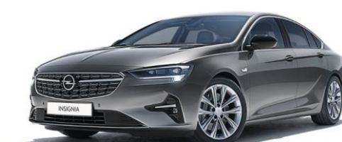
GF6 - Satin steel Grey