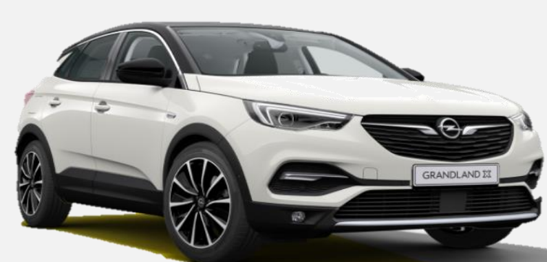
Pearl White G1o 7 900kr