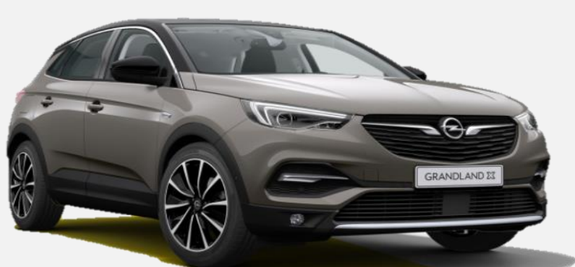
Moonstone Grey G4o 6 900kr