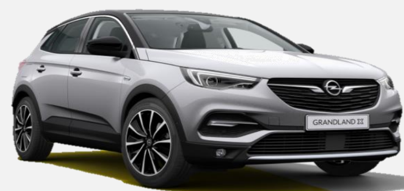
Quartz Grey G4i 6 900kr