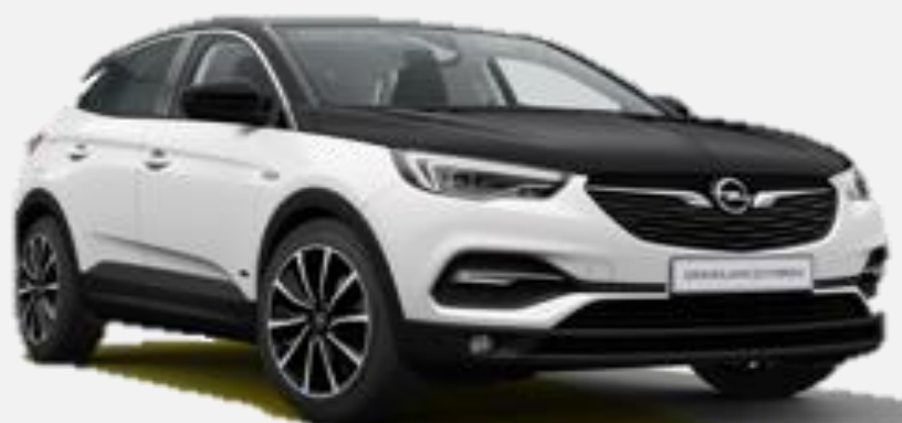
Svart Motorhuv CNP 2 500kr Tillval Ultimate