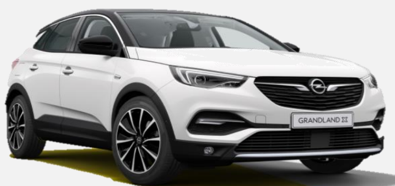
White Jade G20 0 kr