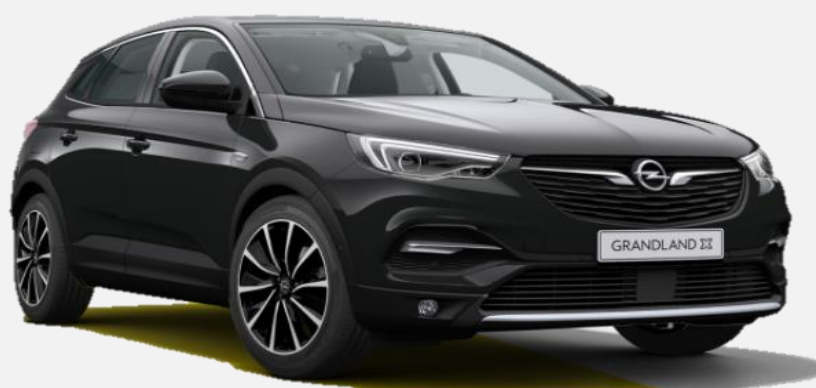
Diamond Black G70 6 900kr