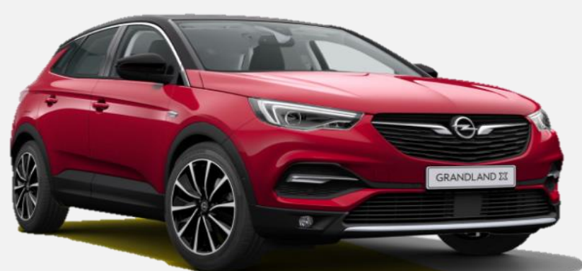
Dark Ruby Red GDU 7 900kr