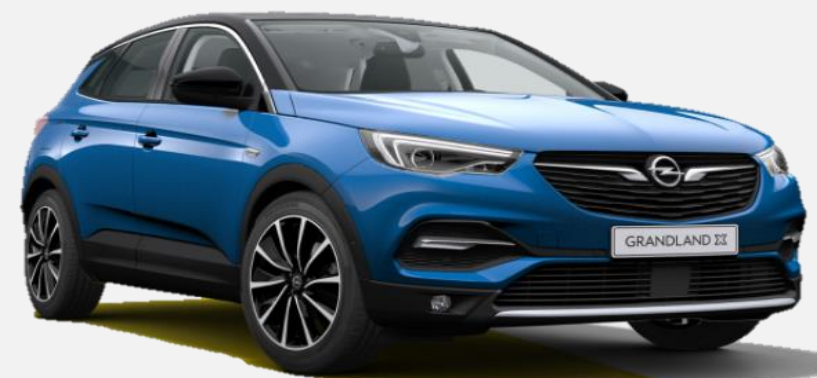
Topaz Blue G8Z 7 900kr