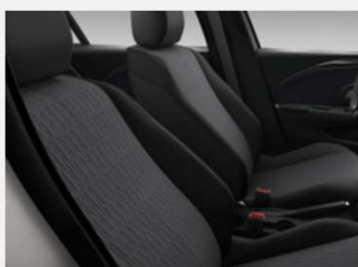
Design & Tech, Marvel Black - TAY9