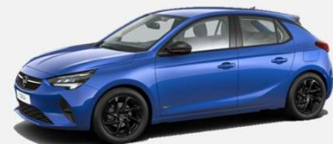
Voltaic Blue- GGI 4 900kr