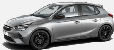
Quartz Grey - G4I 4 900kr