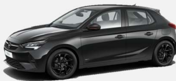
Diamond Black- G7o 4 900kr