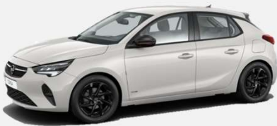
White Jade - G2o 0 kr