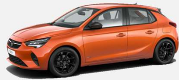
Orange Fizz- GPQ 4 900kr