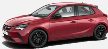
Hot Red - G1R 4 900kr