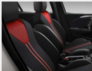
Banda, Marvel Black - TAVF