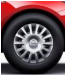
RRB (14" stålfälg)