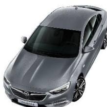
Satin Steel Grey