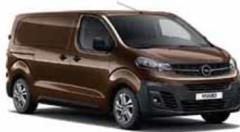
Rich Oak Brown